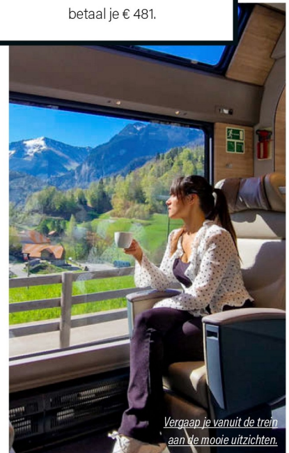
Vergaap je vanuit de trein aan de mooie uitzichten.

Het aanschaffen van een Swiss Travel Pass is voor een meerdaagse treinreis een must. Hiermee kun je namelijk overal het openbaar vervoer pakken. Met één ticket reis je drie tot vijftien dagen per trein, bus en boot door heel Zwitserland. Daarnaast krijg je gratis toegang tot meer dan vijfhonderd musea en er zitten gratis tickets voor de bergen en gebieden Rigi, Stanserhorn en Stoos bij. Ook krijg je op vertoon van de pas vijftig procent korting op de meeste bergexcursies. De pas is alleen geldig voor mensen die niet in Zwitserland of het vorstendom Liechtenstein wonen. Voor een vierdaagse tweede klas-Swiss Travel Pass betaal je € 303, voor de eerste klas betaal je € 481.