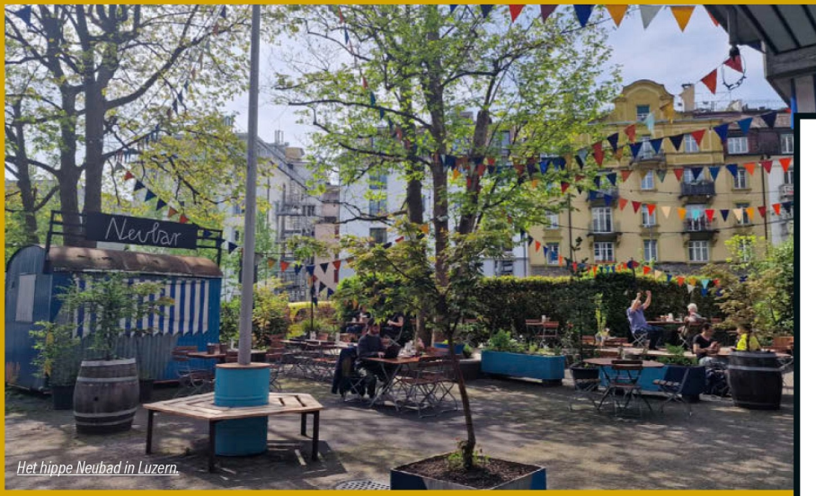
Het hippe Neubad in Luzern.