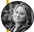
LIEKE LITTLEWANDER- BOOK