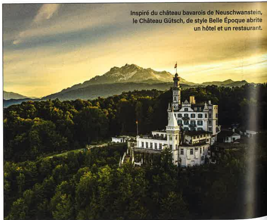
Inspiré du château bavarois de Neuschwanstein, le Château Gütsch, de style Belle Époque abrite un hôtel et un restaurant.

9h18. Départ avec le Gotthard Panorama Express, autre train mythique. Direction Lucerne et le lac des Quatre-Cantons, via une jonction en bateau à Flüelen. Confort maximal et boissons sur demande. Mieux qu'une application, l'un des membres de l'équipe, natif de la région, officie pour donner les explications souhaitées, en plus d'un guide détaillé. Tandis que défilent vallées, monts enneigés, torrents et pâturages verdoyants, ce dernier nous comble de ses anecdotes. La compagnie du Gotthard Express a été fondée en 1871. Un an plus tard, l'ingénieur Louis Favre obtient l'autorisation pour lancer le chantier du tunnel. Il faudra des ouvriers courageux et dix ans de travaux avant que la ligne puisse être ou-