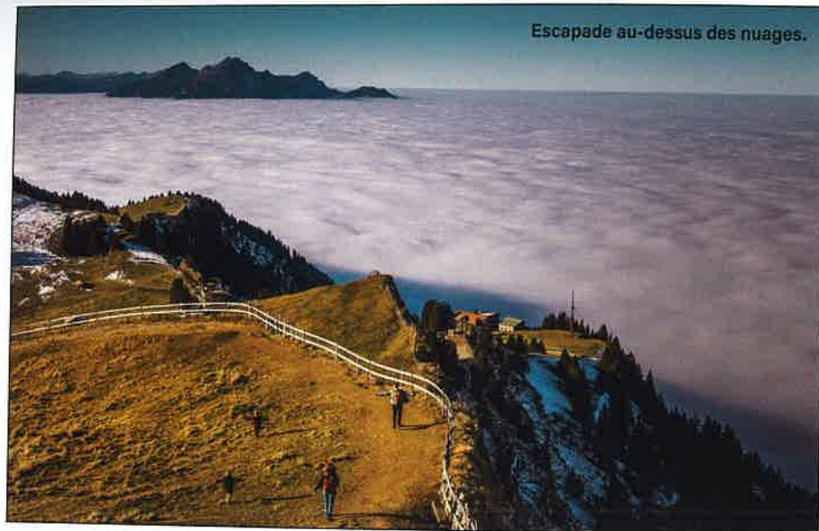
Escapade au-dessus des nuages.