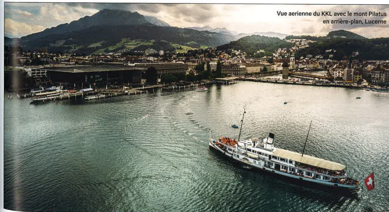
Vue aérienne du KKL avec le mont Pilatus en arrière-plan, Lucerne