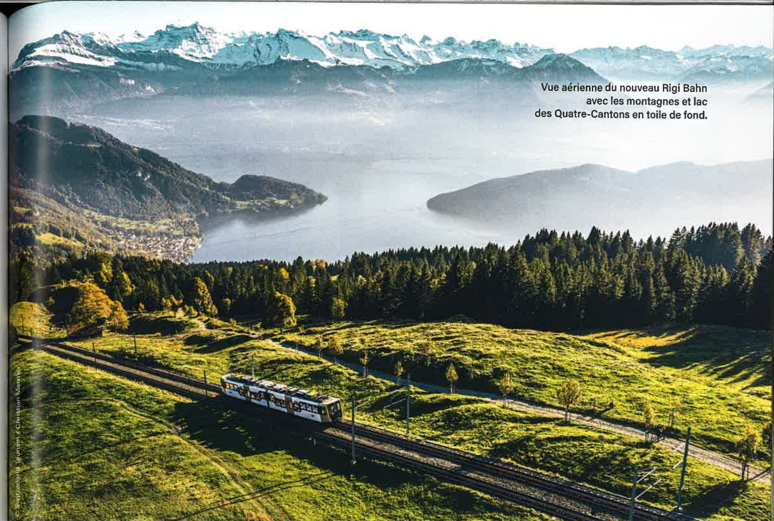
Vue aérienne du nouveau Rigi Bahn avec les montagnes et lac des Quatre-Cantons en toile de fond.

Zürich–Lucerne–Interlaken Ⓞ 2 h 51 min Interlaken–Zweisimmen–Montreux Ⓞ 3 h 5 min Montreux–Visp–Zermatt Ⓞ 2 h 35 min Zermatt–St. Moritz Ⓞ 7 h 46 min St. Moritz–Tirano–Lugano Ⓞ 6 h 46 min Lugano–Flüelen–Lucerne Ⓞ 5 h 25 min Luzern–St. Gallen Ⓞ 2 h 17 min St. Gallen–Schaffhausen–Zürich Ⓞ 2 h 34 min