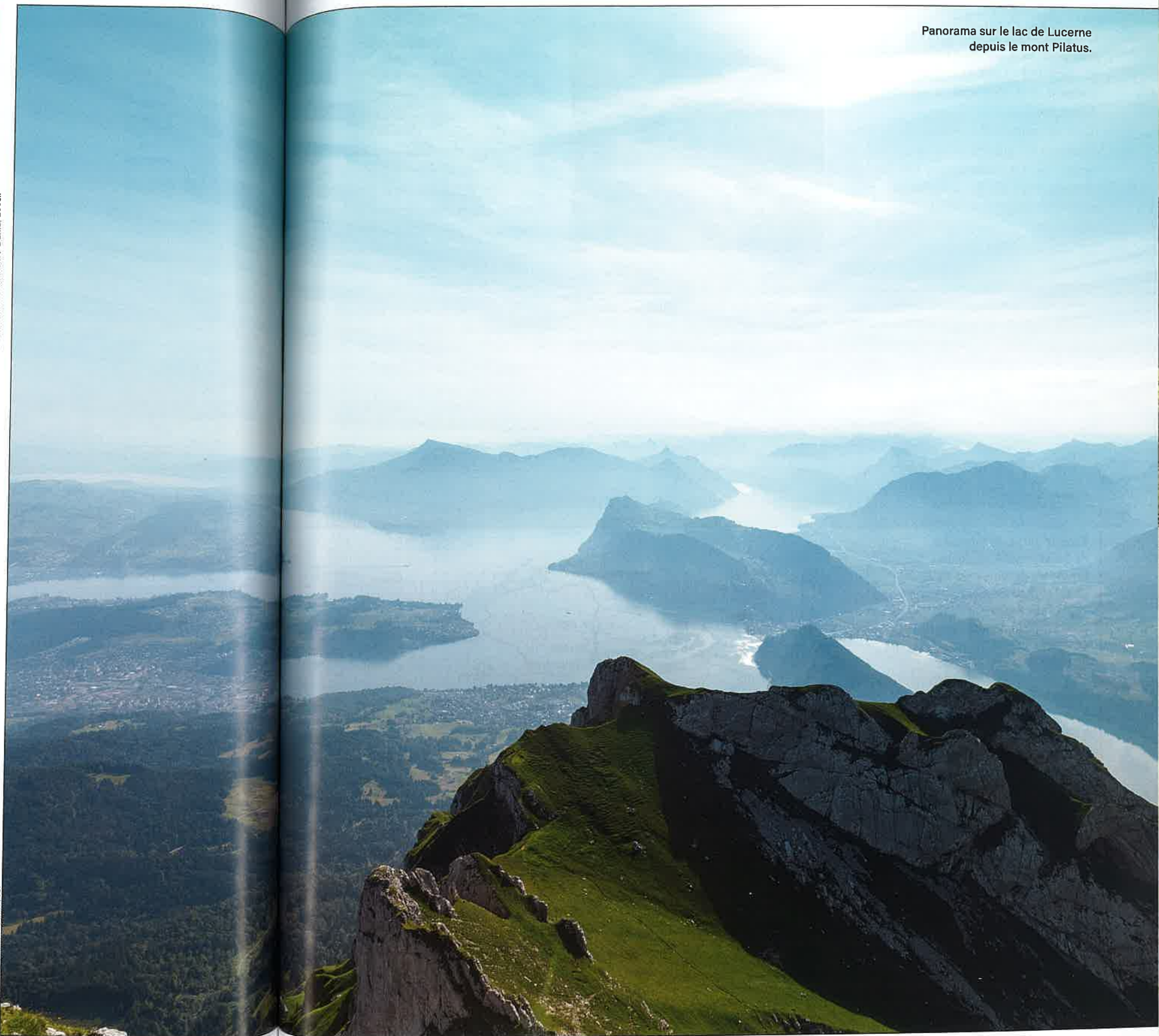
Panorama sur le lac de Lucerne depuis le mont Pilatus.