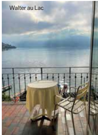
Walter au Lac