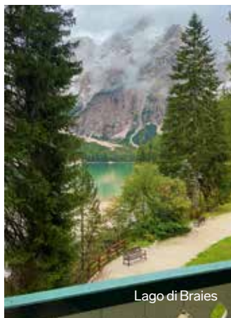
Lago di Braies